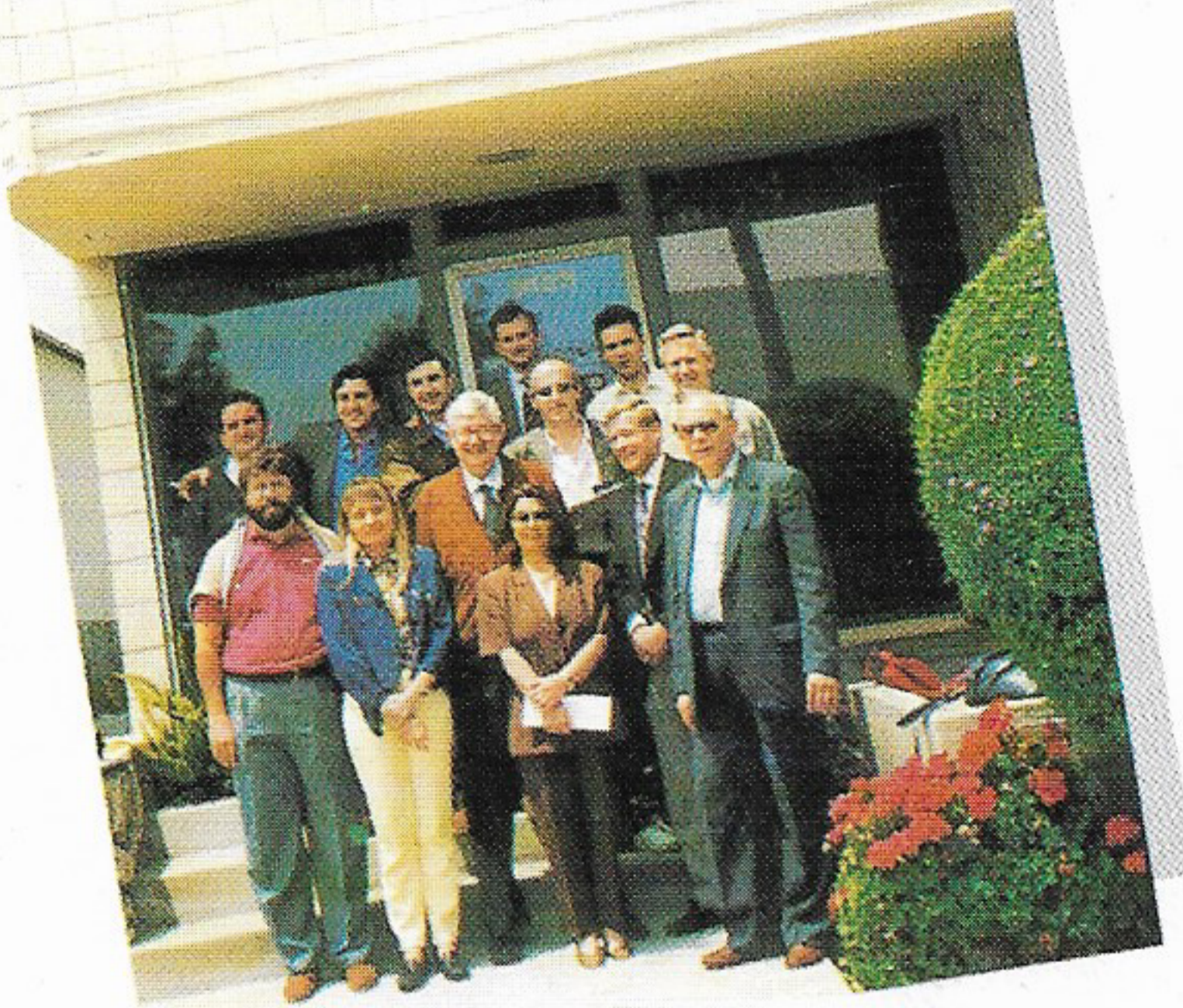
Maggio 1995 - Los Angeles