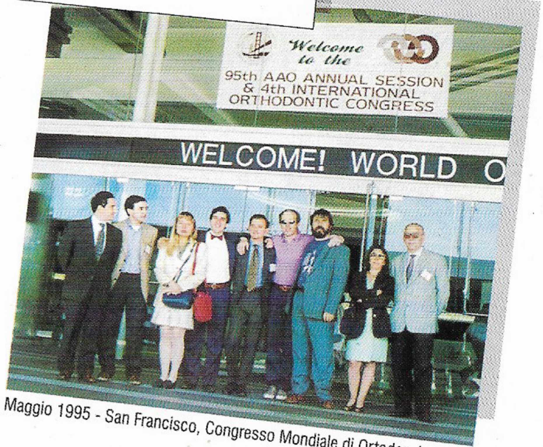
Maggio 1995 - San Francisco, Congresso Mondiale di Ortodonzia